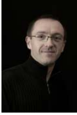
Jean-William CHALOPIN Auteur Photographe